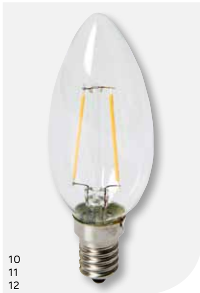
10 11 12